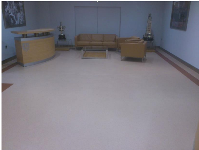
RESULTADO FINAL: Pavimento decorativo con bonito acabado estético