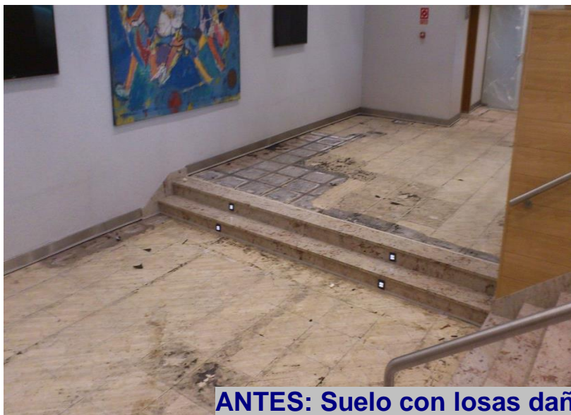
ANTES: Suelo con losas dañadas en muy mal estado