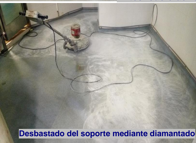
Desbastado del soporte mediante diamantado