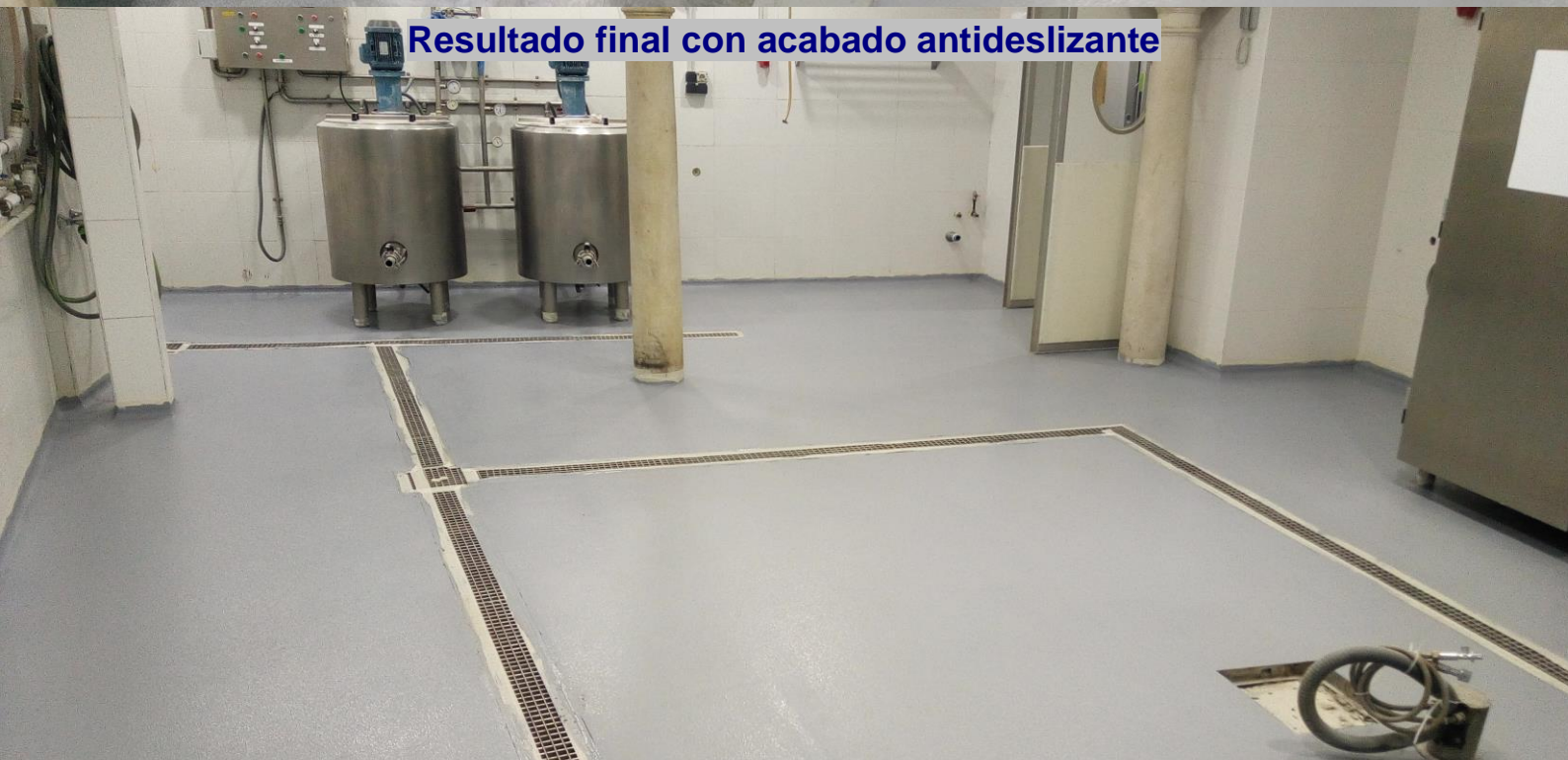
Resultado final con acabado antideslizante