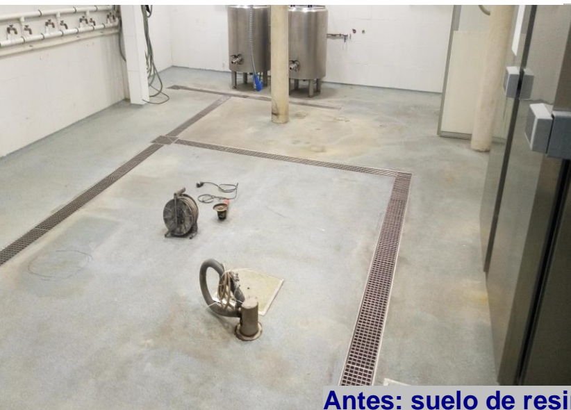
Antes: suelo de resina en mal estado